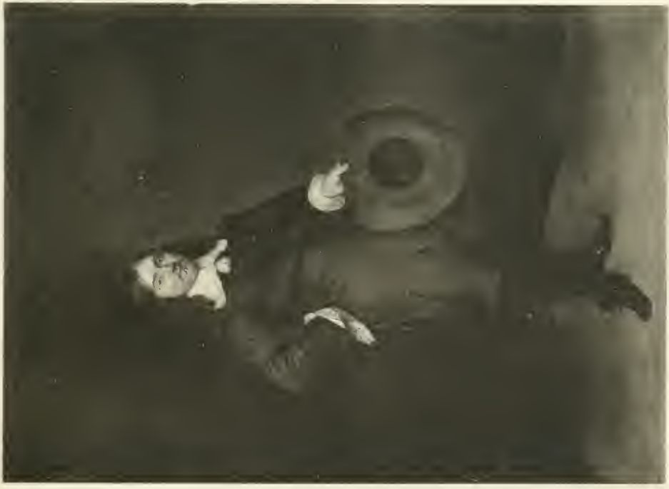
COLL. MR. W. L. DUYEN GLASDOET